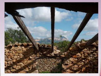
3er premi XIV Concurs - PILAR MIRALLES OLIVER