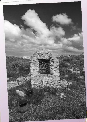
Ter premi XIV Concurs - ANDRÉS CARRIÓ ESCALES