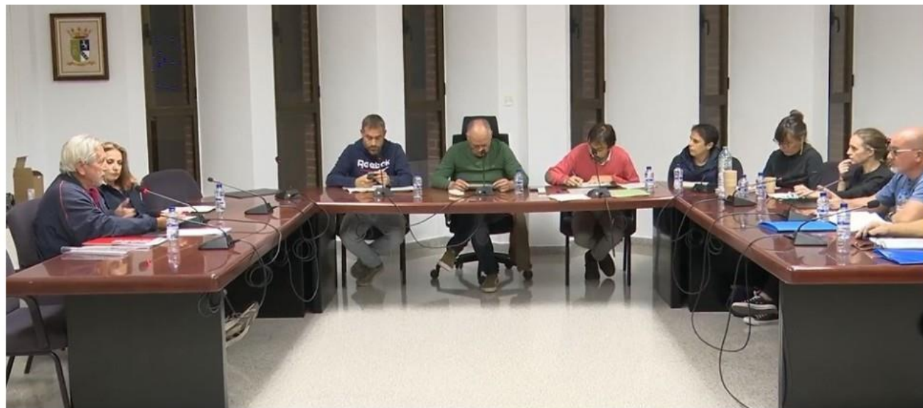
Sesión plenaria del mes de noviembre en Xaló / Radio Litoral

El incremento aprobado supone pagar unos 40 euros más por vivienda