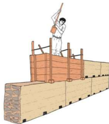
Construcció d'una tàpia amb encofrat de fusta.