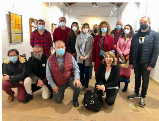
1.a Sala, 5