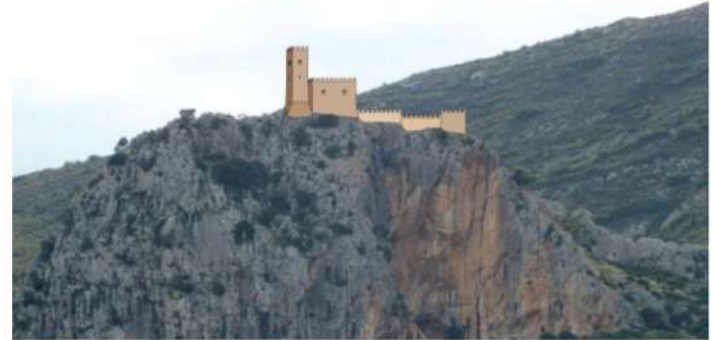
Reconstrucció visual del castell des del nord