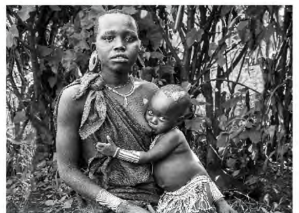
Premi "Lactància materna en altres cultures", patrocinat per l'Ajuntament de Pedreguer.

Al web del Grup Nodrixa es poden veure totes les fotos guardonades, així com l'acta del jurat.