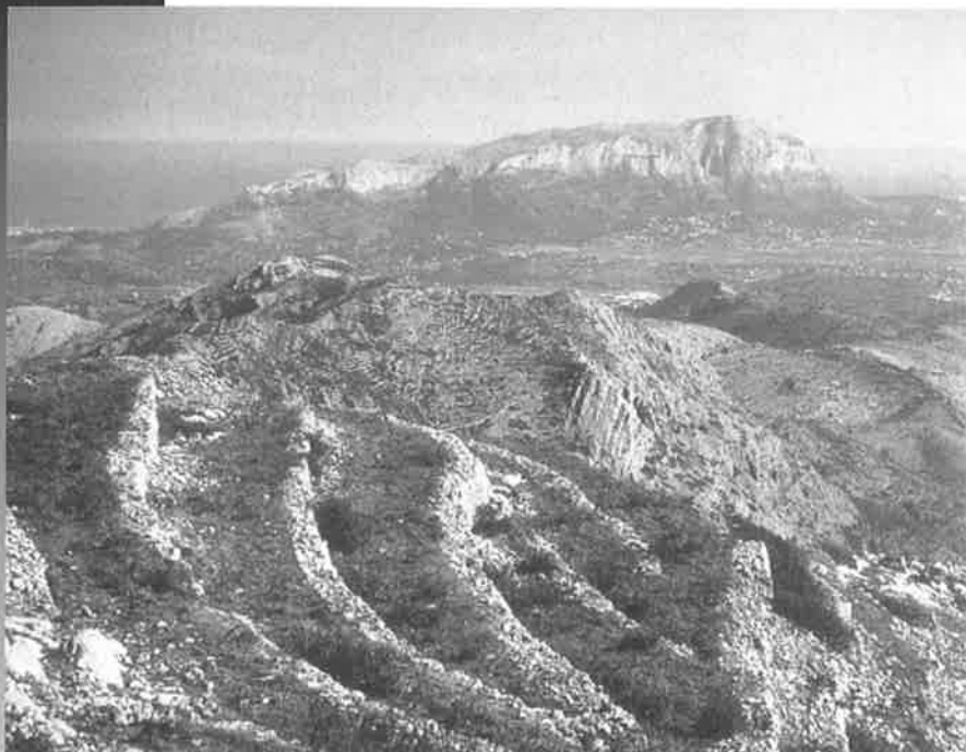
Vista del Montgó des del Castellet d'Aixa