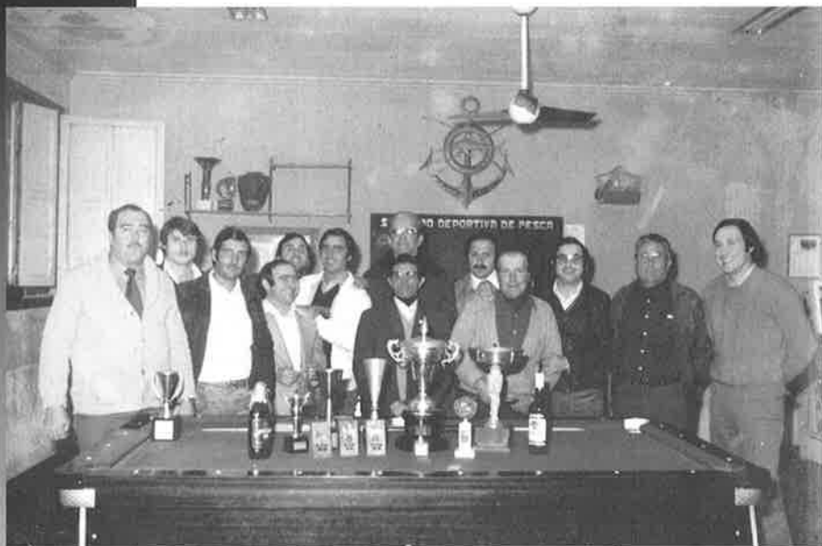
Primera entrega de premis de la Societat