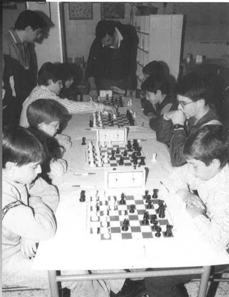
1 Torneig d'escacs escolar • 11 d'abril de 1992