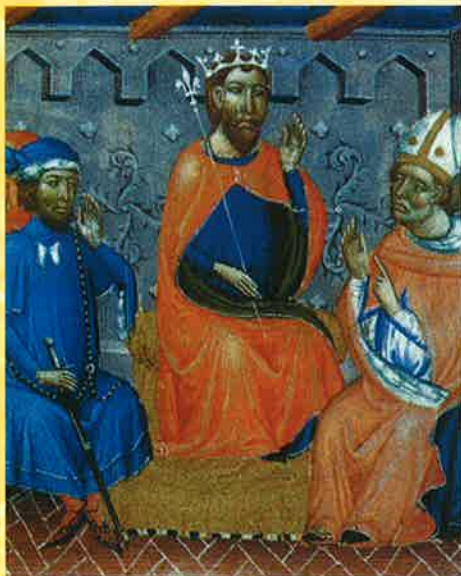
El Rei i els seus consellers, Llibre Verd, s. XIV

El 9 d'octubre del 1238 el rei Jaume I entrà a la ciutat de València i, des d'aleshores, els valencians considerem aquesta data com la fita històrica d'incorporació del poble valencià a la cultura occidental i al món modern. Ara, 761 anys després, a les portes de l'any 2000, la data del 9 d'octubre ha de significar, pels valencians i valencianes, el record d'aquell fet històric i, tocant de peus a terra, un referent per a encarar el nostre futur col·lectiu com a poble.