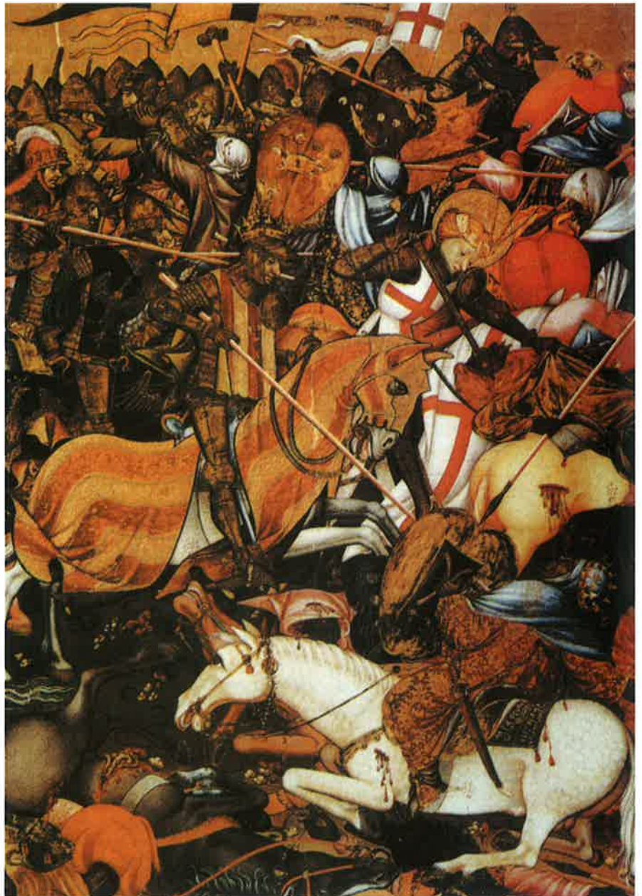
Batalla del Puig, retaule de Sant Jordi, M. de Sax, ss XIV - XV.