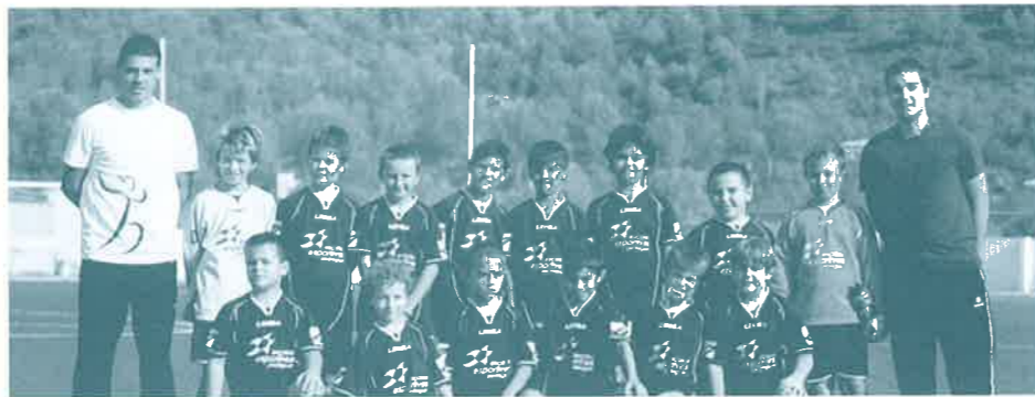
RESULTATS DE LA PRETEMPORADA

La majoria dels partits han estat molt igualats i emocionants, amb resultats prou ajustats. L'objectiu de la pretemporada a l'Escola de Futbol no és altre que una presa de contacte entre els jugadors per contribuir en alguns casos a confeccionar els equips i en altres a habitar-se al ritme de competició.