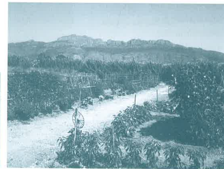
Hort de similars característiques a la Comarca