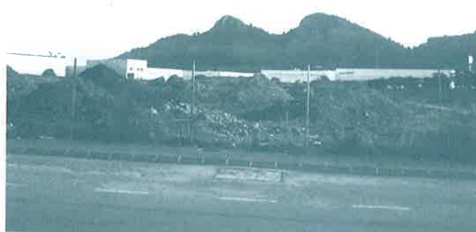
1700 m2 al Carrer dels Vinyaters del polígon industrial de les Galgues 2,

SI DESITGEU MÉS INFORMACIÓ: MEDIAMBIENT@PEDREGUER.ES 644428791 · 629670584