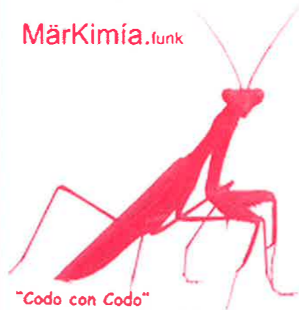
"Codo con Codo"