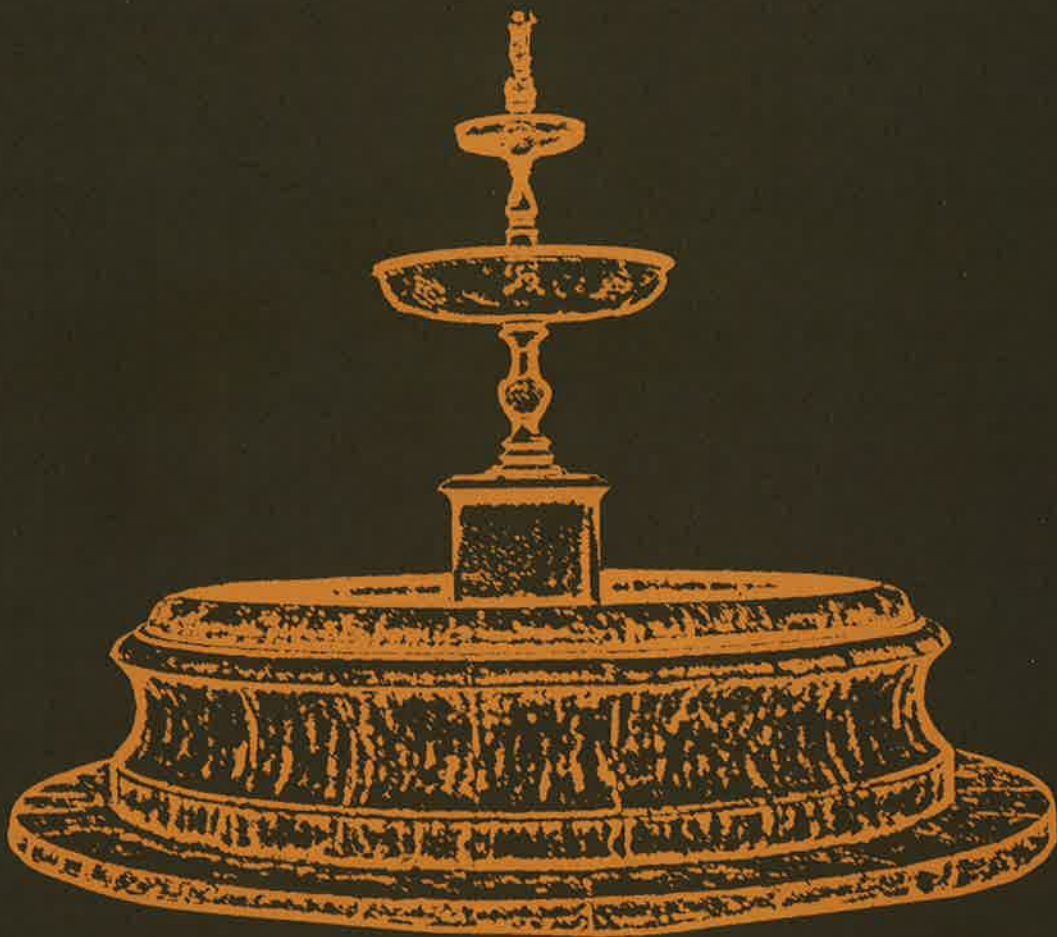
FONT DE LA GLORIETA (PRINCIPIS S. XX)

Amb el desig d'un 2007 en què el diàleg siga l'únic emblema per a la pau.