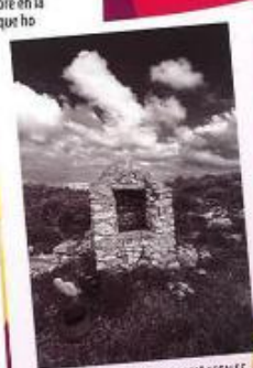
1er premi XV Concurs - ANDRÉS CARRO ESCALES