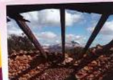
3er premi XV Concurs - PILAR MIRALLES OLIVERA