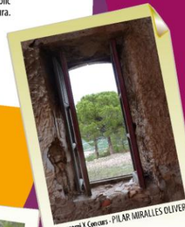
1er premi X Concurs - PILAR MIRALLES OLIVER