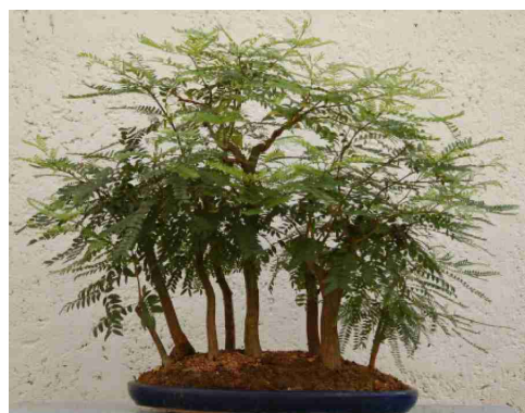
La Sala 7

Horari: dissabtes, des de les 10.00 fins a les 14.00 h laborables, des de les 10.00 fins a les 20.00 h