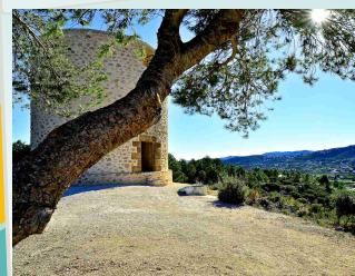
3er premi XV Concurs JUAN BAUTISTA MARTÍNEZ MORENILLA