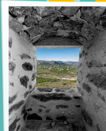
2n premi XV Concurs DOMÍNGO ALEJANDRO ARGUDO MULET