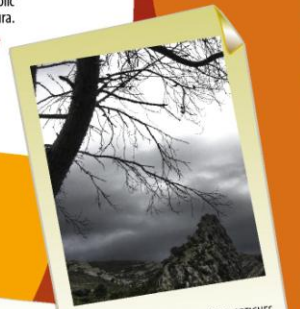
1er premi XI Concurs MIQUEL A. NOGUERA ARTIGUES