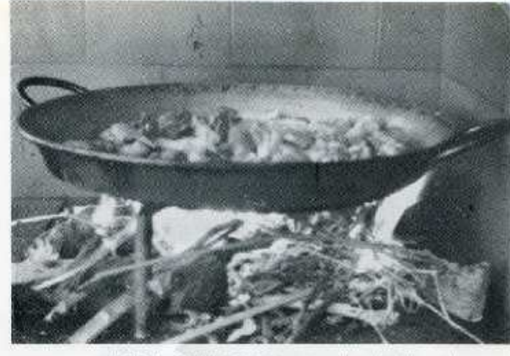
Al pie de esto fato, que por su aspecto y ofarcillo puede compotir con la major de los puellos de la región valenciana, no cabe atro comentario más apropiado que el siguientes "bon profis".