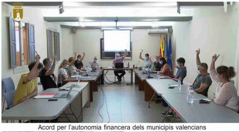
Acord per l'autonomia financera dels municipis valencians

Finalment, el Ple de l'Ajuntament de Pedreguer va aprovar el Pla Local de prevenció d'incendis i el Pla Local de cremes (amb l'abstenció de la CUP) i una moció (amb l'abstenció del grup popular), per demanar que torne a Pedreguer el servei de carteria que Correus va suprimir el passat 1 de juliol.